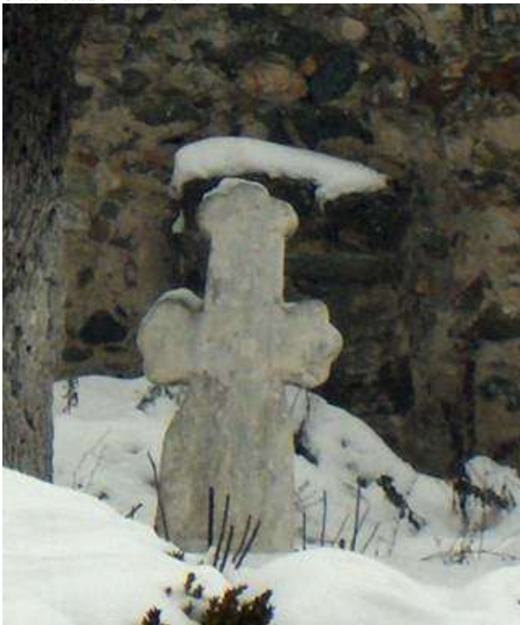
Cruce trilobată din avlia Bisericii