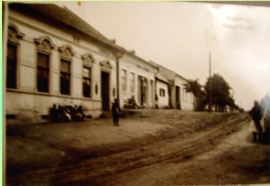
Dubaucea - vedere spre spital (pe stânga, vechea Farmacie)