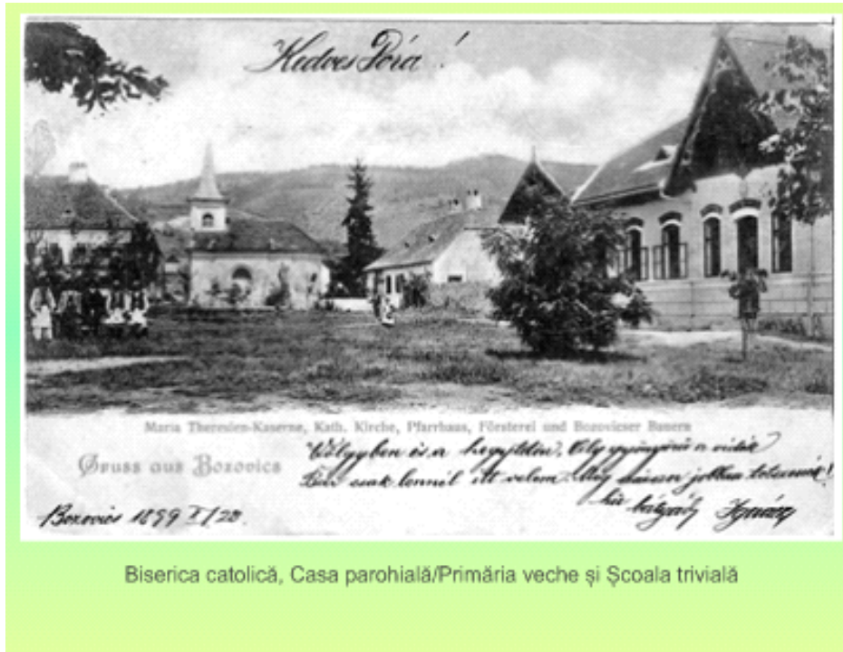
Biserica catolică, Casa parohială/Primăria veche și Școala trivală