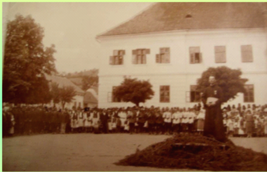
Cazarma - Discurs înainte de 1929 (nu apare statuia lui Eftimie Murgu)