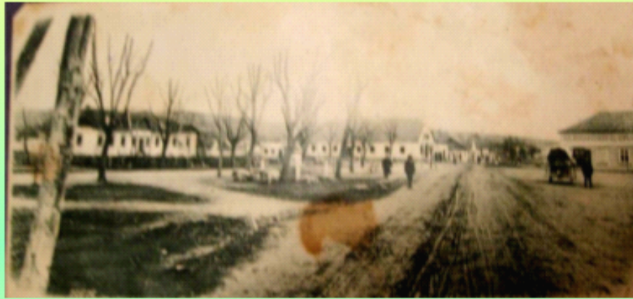
Centrul Bozoviciului înainte de 1900 cu Scoala Triviala/Ocolul Silvic (nu apare Almăjana dar nici magazinul lui Magyari)