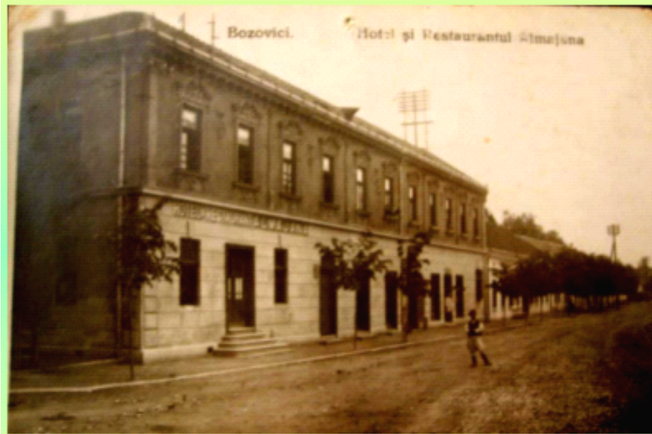
Hotel -Restaurant Almajana