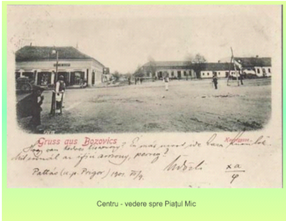
Centru - vedere spre Piațul Mic