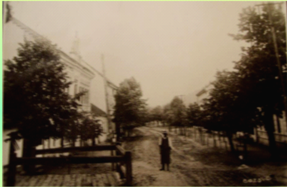
Dubaucea - vedere spre pod (după Farmacie era un pod de lemn peste ogașul care vine de pe Băclan, apoi casa lui Iancu Conciatu, Hanul col. Popiști - actualul liceu. Se vede casa av. Străin și casa lui Sperger)