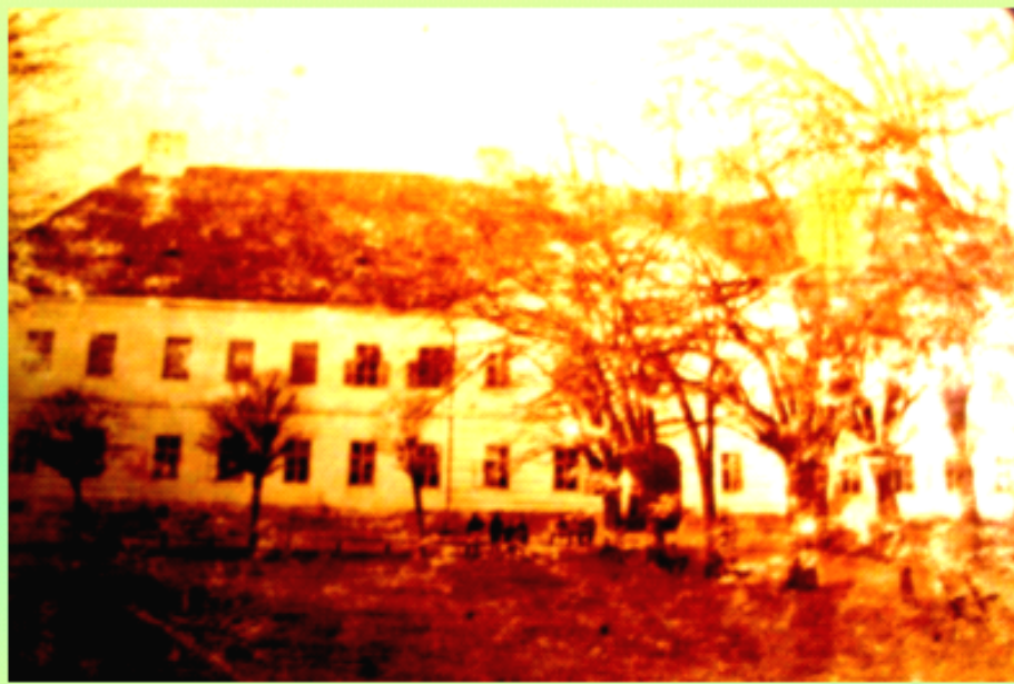
Cazarma (vedere dinspre parc)